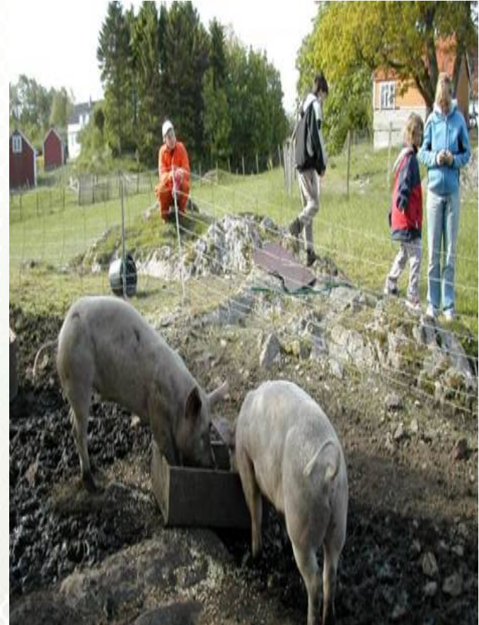
Økonomisk utvikling skole/ avlasting